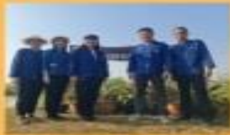
มีการปลูกผักสวนครัว