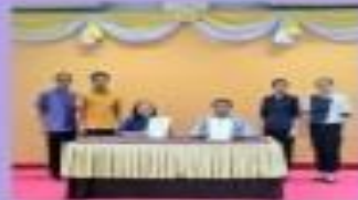
บุคลากรในสังกัดทุกคน มีความรู้ความเข้าใจ

ส่งเสริมคุณธรรมเป้าหมาย "วินัย" การสร้างความรู้ความเข้าใจในการปฏิบัติ ตามวินัยทางราชการ ระเบียบ กฎหมาย ที่เกี่ยวข้อง