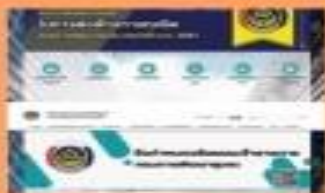
มีการประชาสัมพันธ์ กิจกรรมคนละ 1 ชั่วโมง