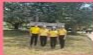
มีส่วนร่วมกิจกรรม จิตอาสา คนละ 1 ครั้ง

ส่งเสริมคุณธรรมเป้าหมาย "จิตอาสา" ร่วมกิจกรรมจิตอาสา