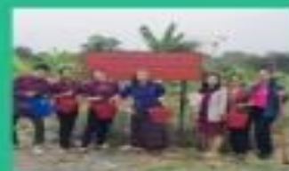
ร่วมกิจกรรมดูแลรักษาป่า อย่างน้อยคนละ 1 ครั้ง